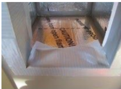
Doble la solapa