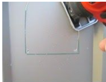
Meta la sierra y corte lentamente