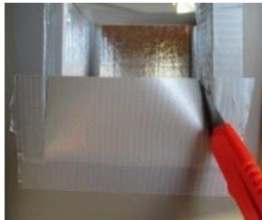
Corte el otro lado