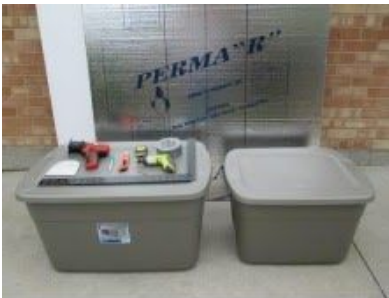
Todos los suministros