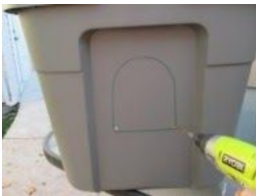
Taladre al menos un agujero