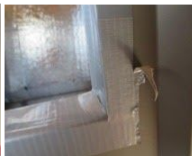
Quite el exceso