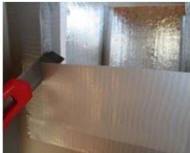
Corte un lado