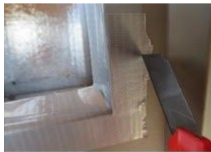
Recorte el borde desordenado