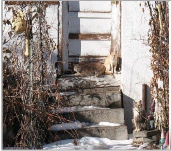
Los gatos de Elati quienes me enseñó como construir los refugios!