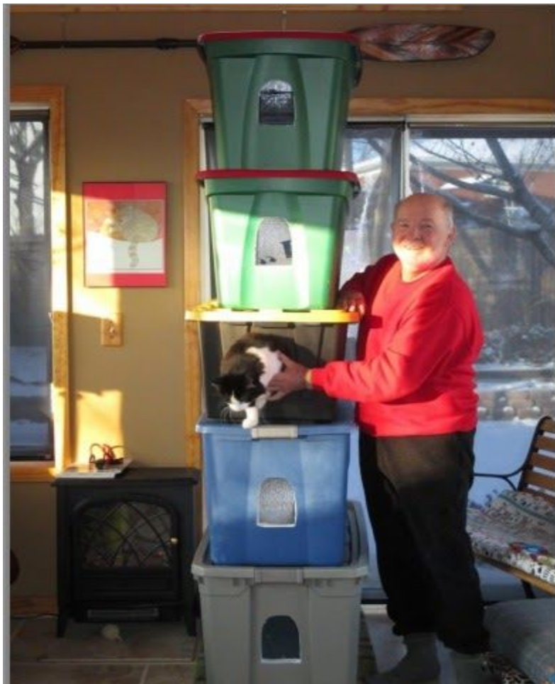
Puede crear un refugio de cualquier tamaño - solo hay que medir, marcar y cortar mientras trabaja.