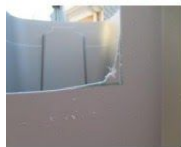
Acabe las equinas

Corte la puerta 5 1/2" arriba del suelo. La puerta debe ser 5" de ancho al posterior y 5 3/4" de alto al centro.