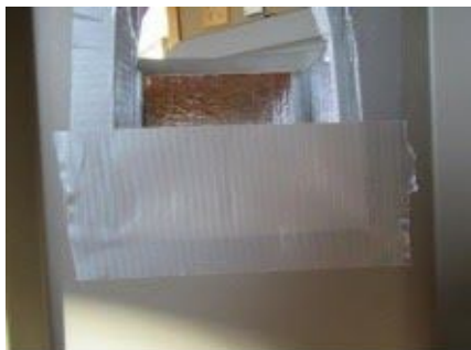
Ponga cinta en la frente

Para terminar, ponga cinta en la parte inferior. Ponga cinta a lo largo del interior de la puerta con un pedacito de ¾” de cinta en la caja, corte y pegue cinta en los lados de la puerta con el cuchillo y presione la cinta sobre la puerta y contra el interior del aislante. Arregle la cinta en el exterior de la caja y alise toda la cinta para asegurar un refugio fijo y calentito.